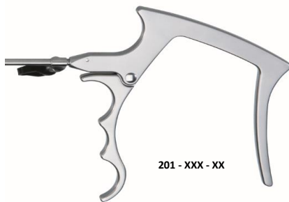
201 - XXX - XX