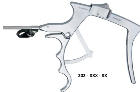
202 - XXX - XX