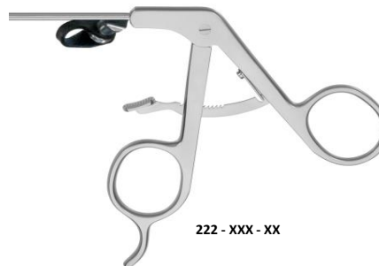
222 - XXX - XX